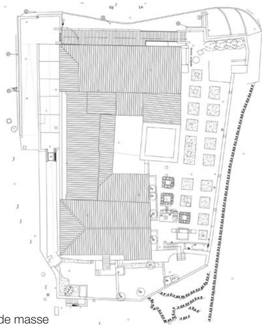
Plan de masse

Images 3D : Accueil et vestiaire ; rampe extérieure musée Picasso ; agence Pierre-Antoine Gatier, Paris