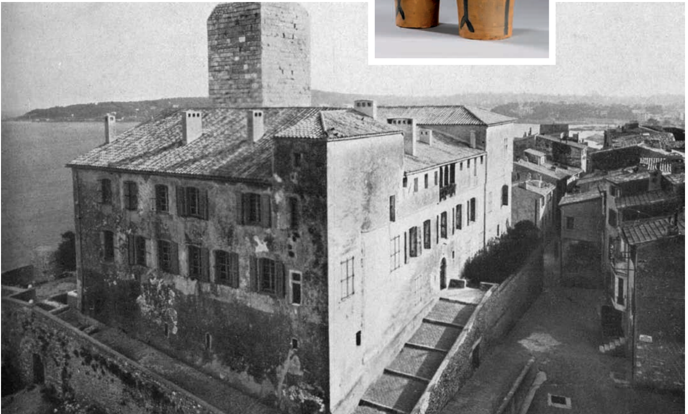
Vue panoramique du musée Picasso In : Cahiers d'Art, 1948, 23 e année

© Succession Picasso, 2008.