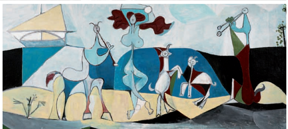
Pablo Picasso La Joie de vivre, 1946 Ripolin sur fibrociment ; 120 x 250 cm Musée Picasso, Antibes