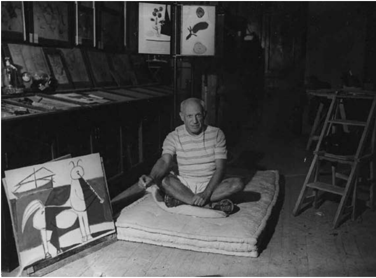
Michel Sima Picasso assis sur un matelas à côté du « Centaure et le navire », 1946 Photographie noir et blanc ; 17,9 x 24,3 cm Musée Picasso, Antibes

Photo © Michel Sima / Rue des Archives © Succession Picasso, 2008. Photo © imageArt, Antibes, Claude Germain